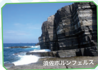
須佐ホルンフェルス

れ山陰と山陽を結ぶ街道「萩往還」、約1400万年前にできたと言われる黒と淡灰色の鮮やかな縞模様の断崖「須佐ホルンフェルス」。萩は歴史・文化・自然と見どころがいっぱいです。