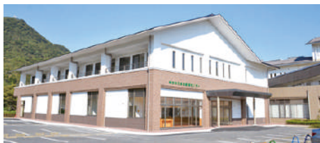
萩市休日急患診療センター