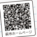
萩市ホームページ

ふるさと納税ポータルサイト「ふるさとチョイス」「ふるなび」「楽天ふるさと納税」「セゾンのふるさと納税」「ANAのふるさと納税」「萩市ふるさと寄付特設サイト」からお申し込みいただけます。